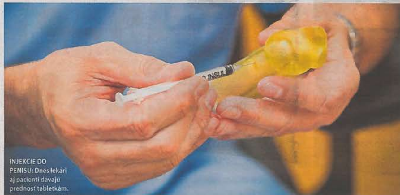
INJEKCIE DO PENISU: Dnes lekári aj pacienti dávajú prednosť tabletkám.