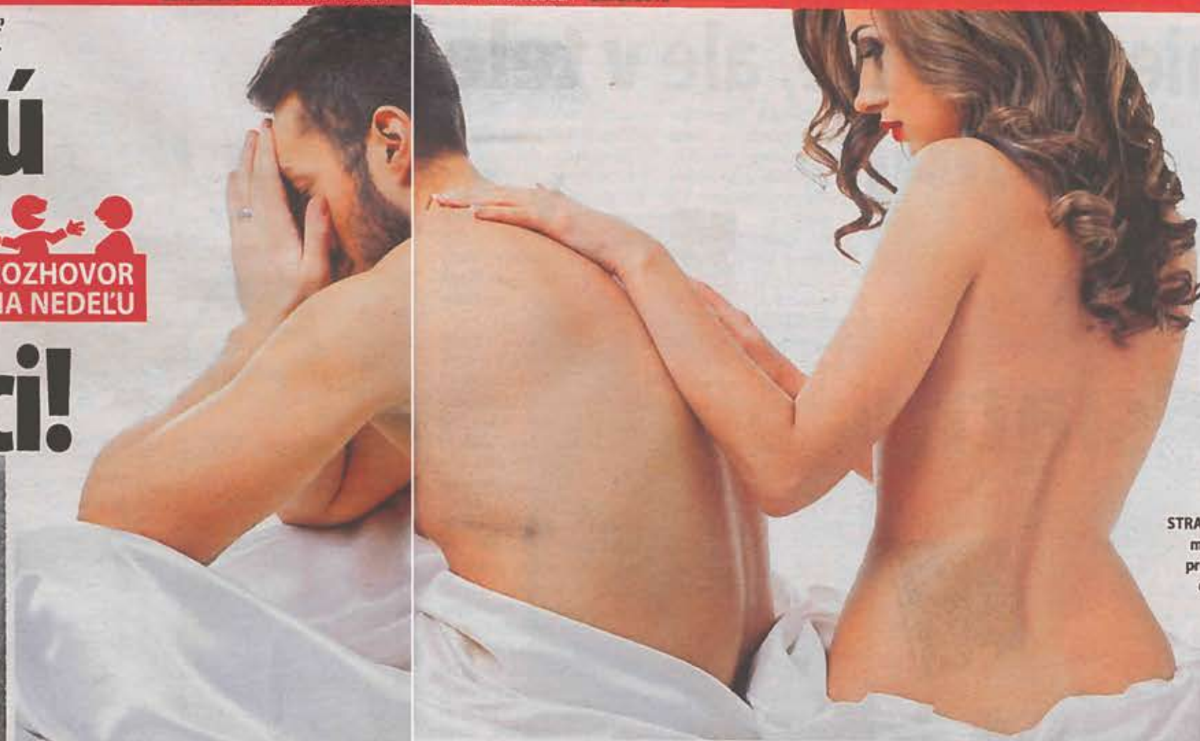
STRACH: Iba 10-20 % mužov, ktorí majú problémy, vyhľadajú odbornú pomoc.

Najčastejším problémom je tzv. erektilná dysfunkcia, teda neschopnosť dosiahnuť alebo udržať erekciu. V minulosti bol zaužívaný aj pojem impotencia. Je to veľmi častá porucha, ktorá negatívne ovplyvňuje kvalitu života muža, jeho partnerky či rodinný život. Často hovorím, že keď pacienta vyliečime, ozdravujeme aj slovenskú ekonomiku. Tento problém totiž znižuje mužovo sebavedomie, spôsobuje chronický stres a tak aj stratu úspechov v práci a obchodoch či pokles imunit-